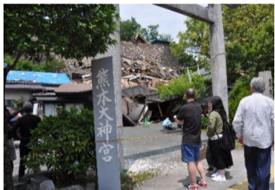
熊本大神宮が石垣崩壊でつぶされていました