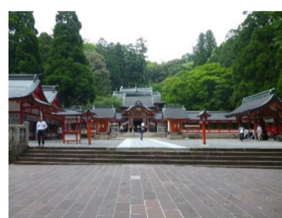
格調高い朱塗りの社殿全景