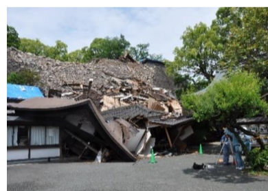
帰りに熊本城にも寄って来ました。