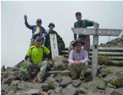
高千穂峰山頂(標高1,574m)