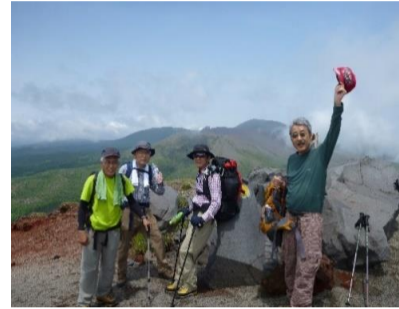
御鉢に着きました