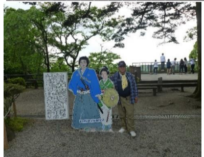
坂本竜馬、おりょうの新婚記念写真