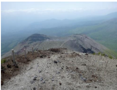
頂上より御鉢を望む

天の逆鉾(大国主神)を通してニニギノミコトに譲渡され、国家安定を願い矛が二度と振るわれないように願いを込めて高千穂峰に突き立てたという伝承がある。