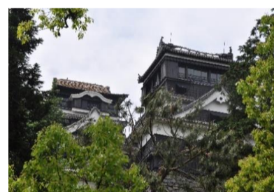
天守閣は鉄筋コンクリート造りでこの有様です