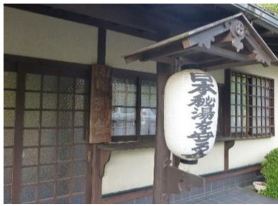
日本秘湯を守る会の本日宿泊南洲館