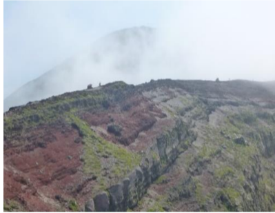
御鉢から見た馬の背