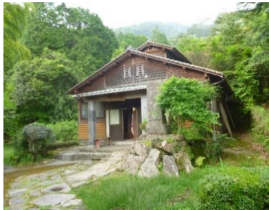
打たせ湯のある竹の湯