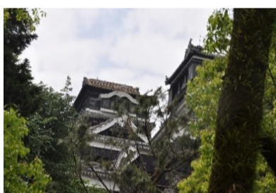
天守閣も大変なことになっています