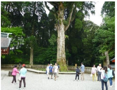
樹齢約800年の御神木 八村杉