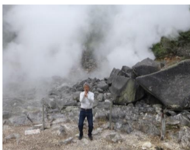
ロープ外は立入禁止