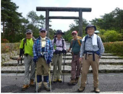
高千穂河原ビジターセンター登山口