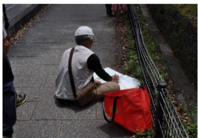
被災状況の絵を書いている人もいます