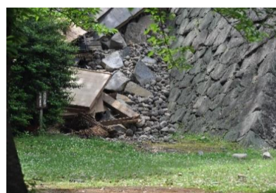
熊本市益城町の皆さまいち早い復興をお祈りします