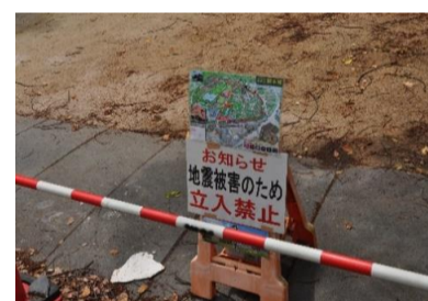
全面立ち入り禁止です