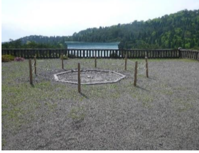
霧島神宮古宮跡まで下山