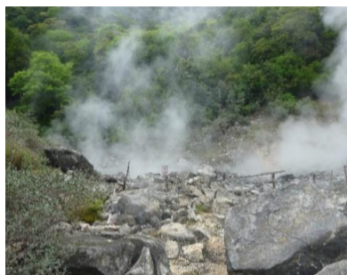
いたる所から噴気が上がっています