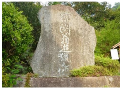
<南洲翁遊獵之地>南洲館の屋号は西郷隆盛が逗留したことに由来